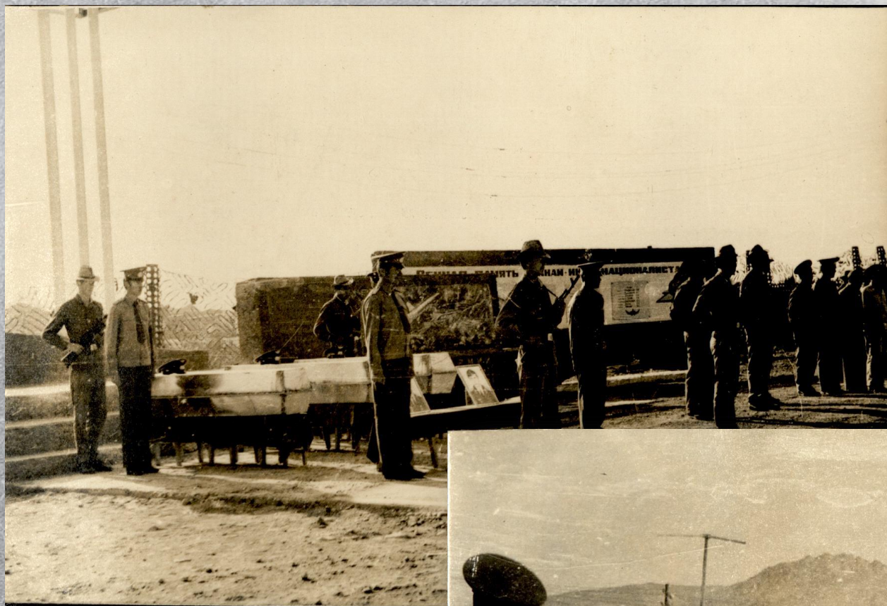
Проводы погибших служивцев в последний путь. г. Кабул. Октябрь 1982 г.